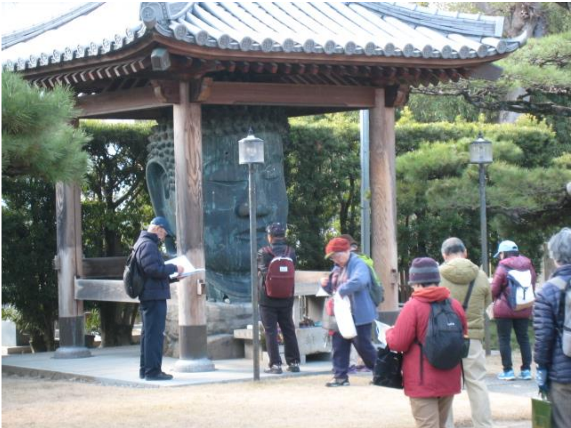
無量光寺の首大佛様