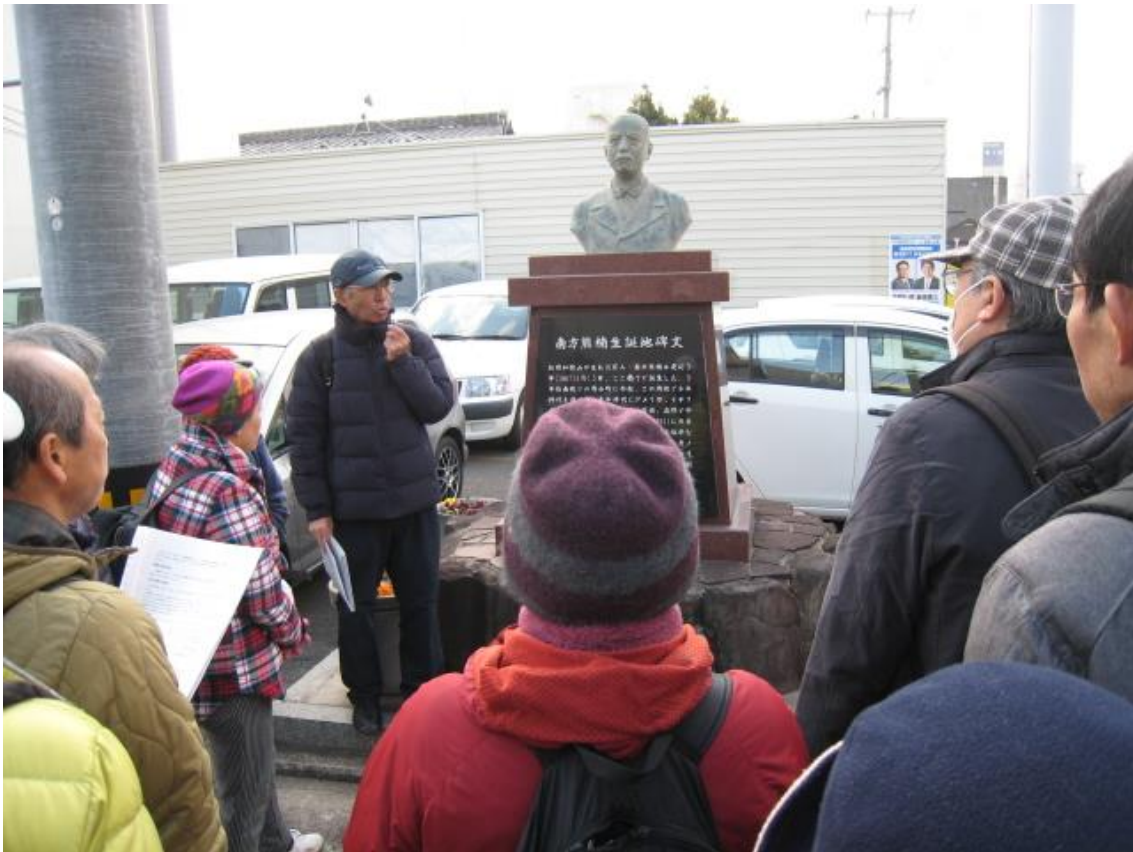
南方熊楠生誕地碑前