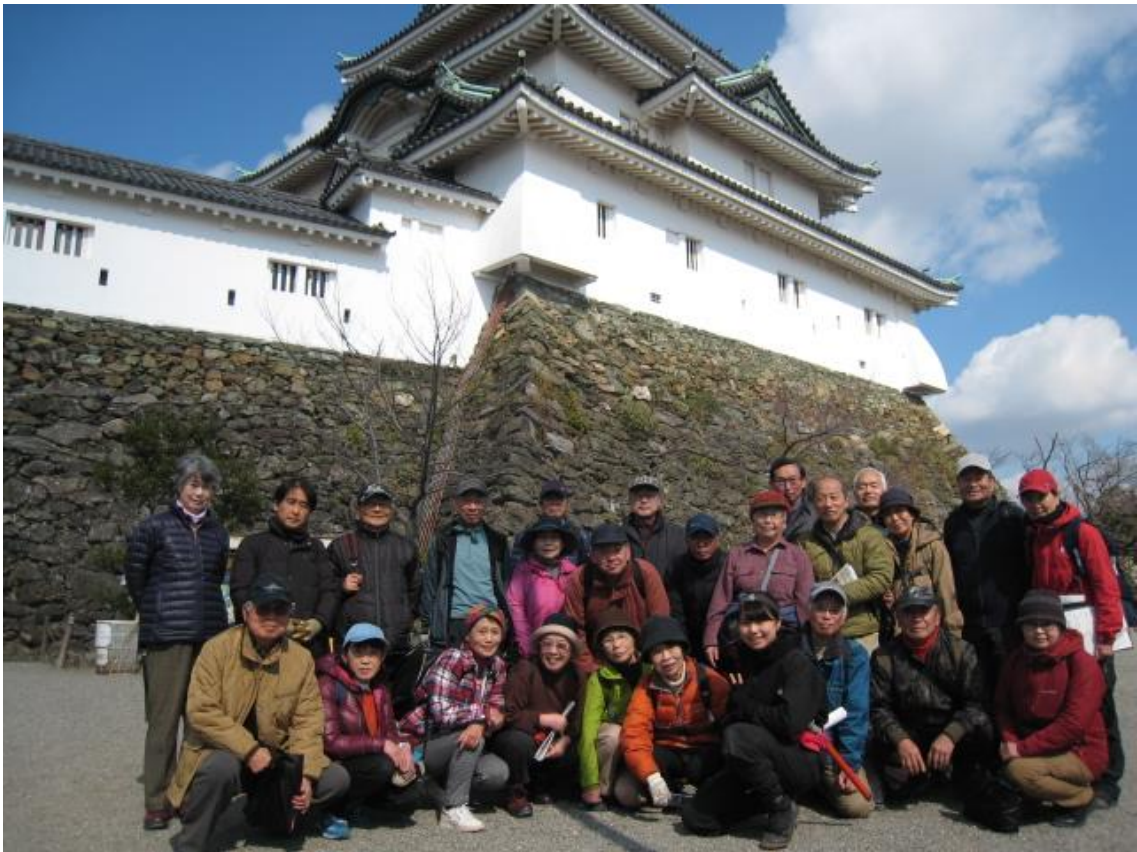
和歌山城復元天守閣前（一番前に忍者姿の無料ボランティアの女性）