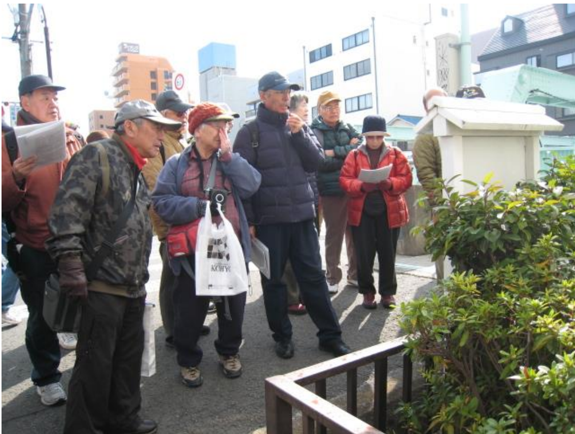
市堀川沿いの地藏堂前