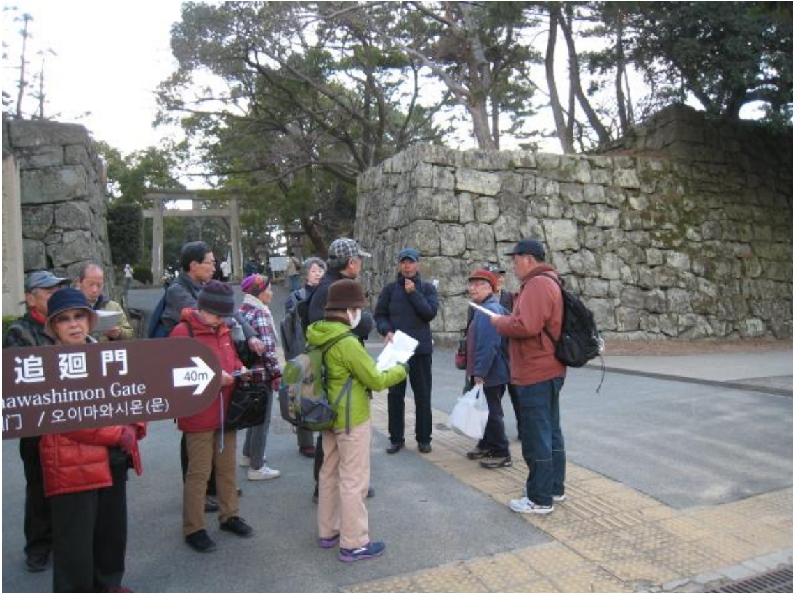
城内追廻門と護国神社前