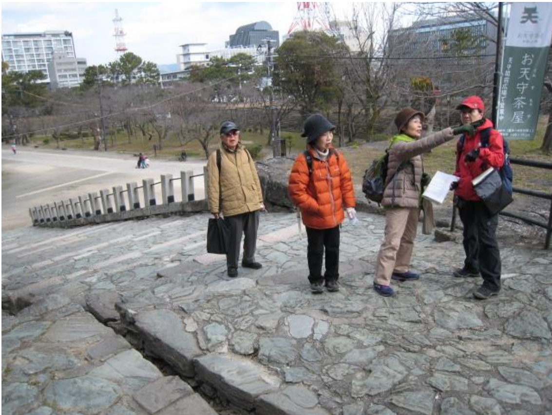
城内の天守閣への道のり