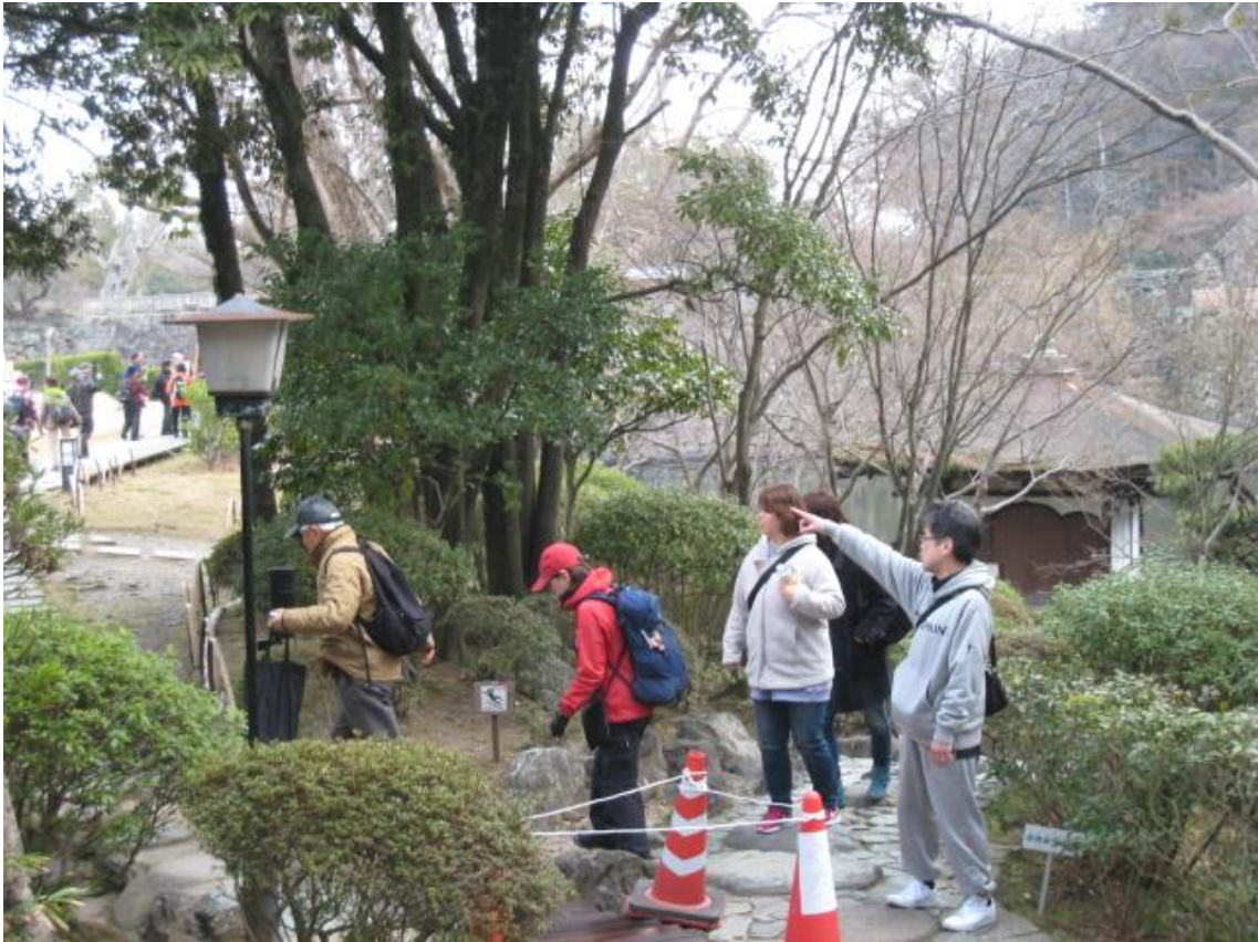
城内の紅葉溪庭園