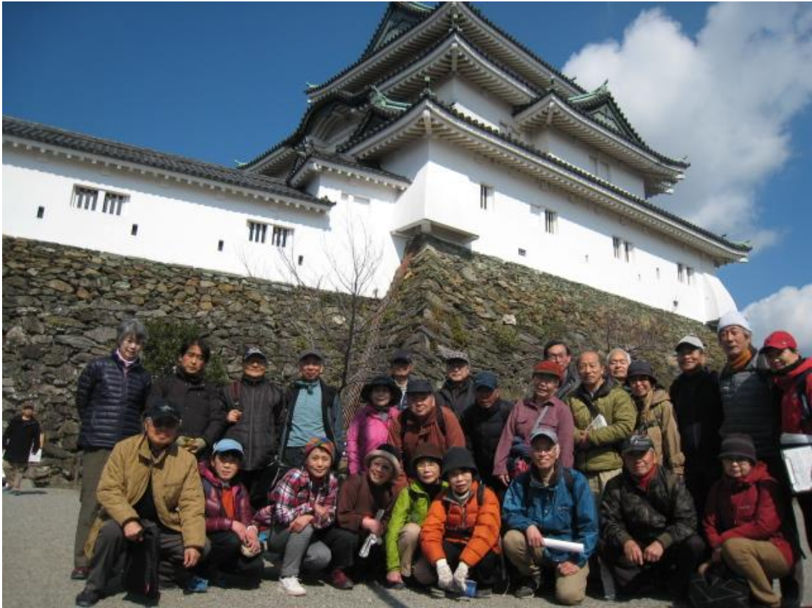
和歌山城復元天守閣前