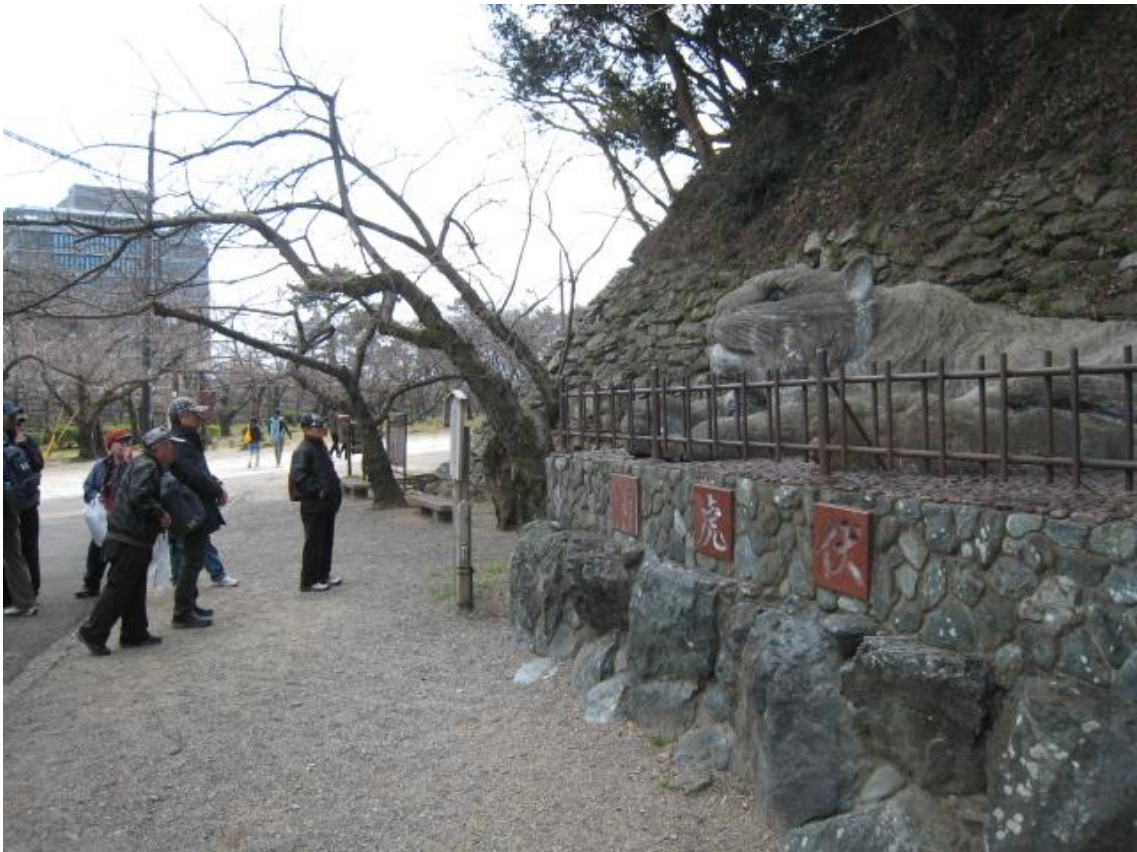
伏虎像（和歌山城の別名にちなんで建てられた）