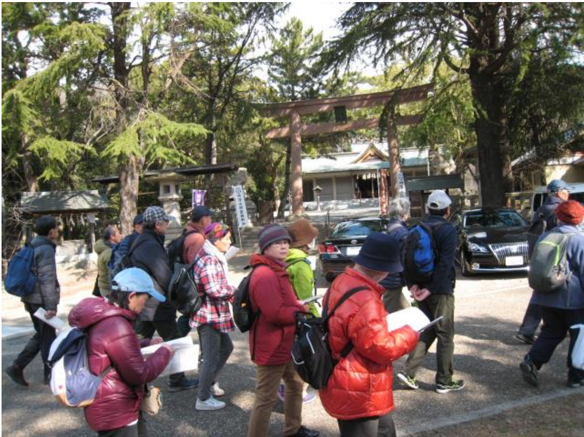
城内護国神社本殿前