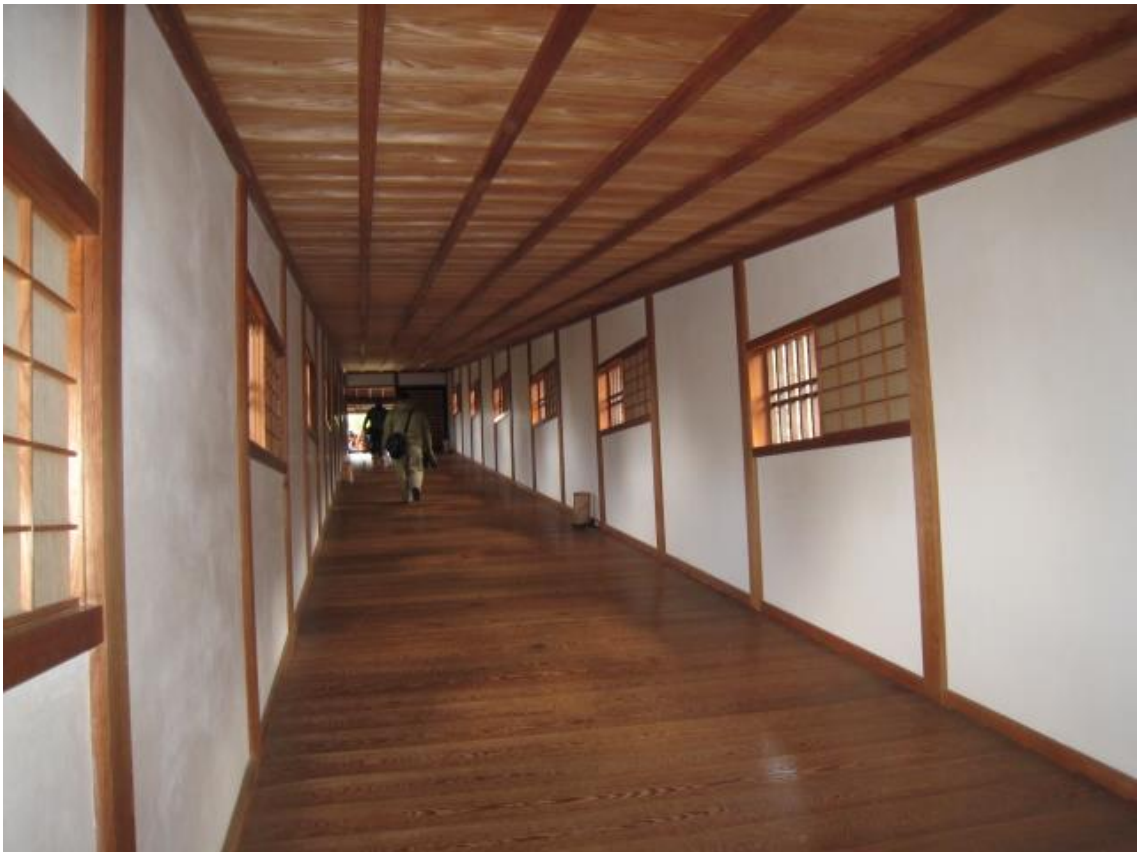
御橋廊下内（殿様とお付の人、奥女中が二の丸と西の丸を行き来する為に架けられた橋）