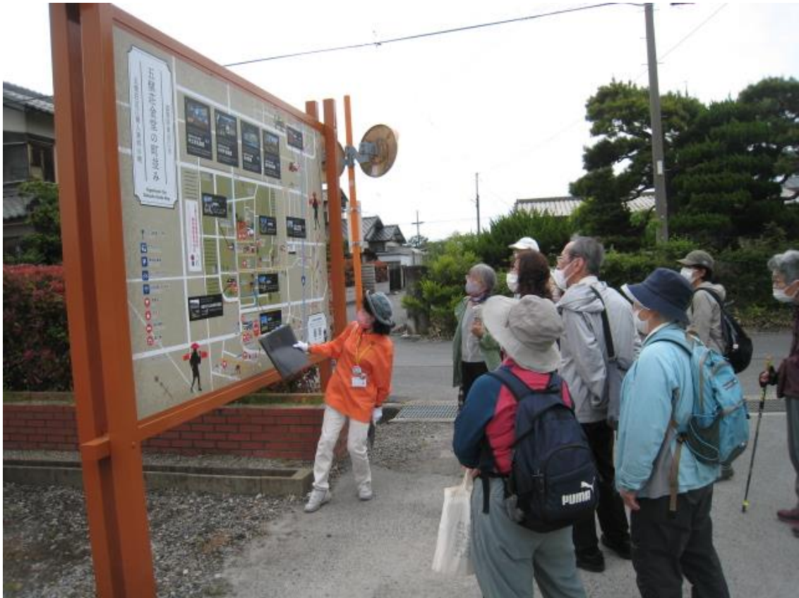
観光案内所駐車場の五箇荘金堂地区案内図前で