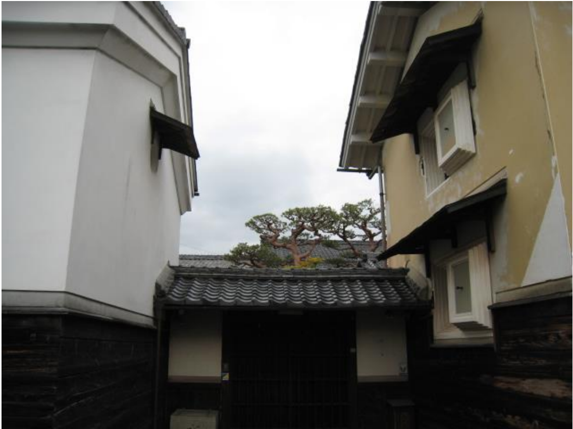
蔵に挟まれた屋敷の玄関門