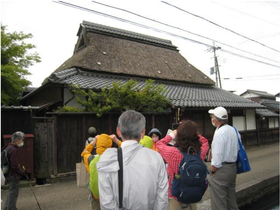
寺前・鯉通りに面する家屋（葎簀葺き・アワビの貝殻）