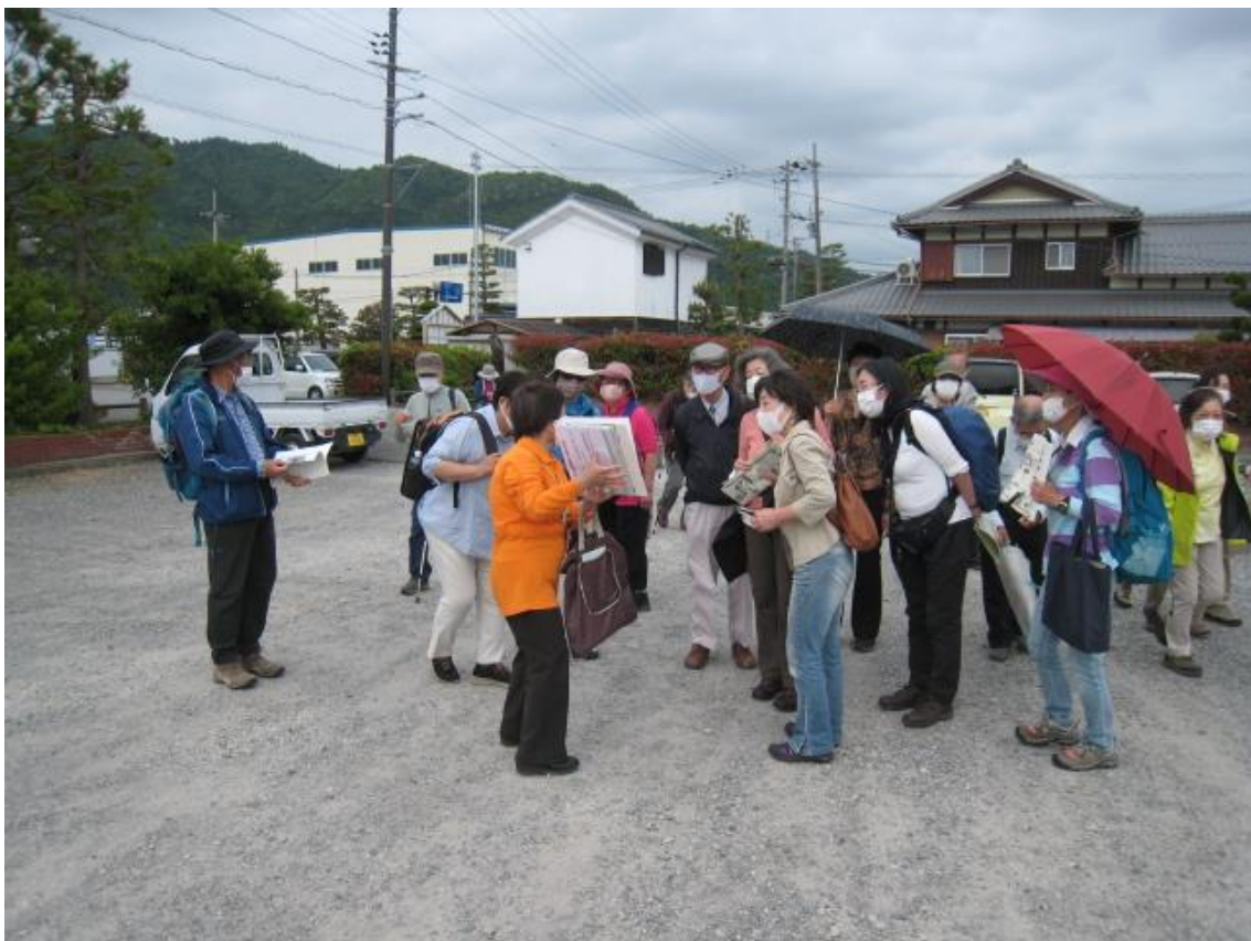
観光案内所駐車場で