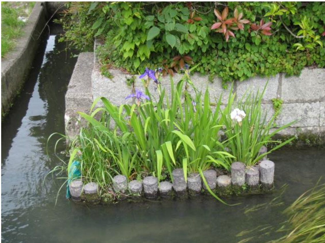
寺前・鯉通りの花