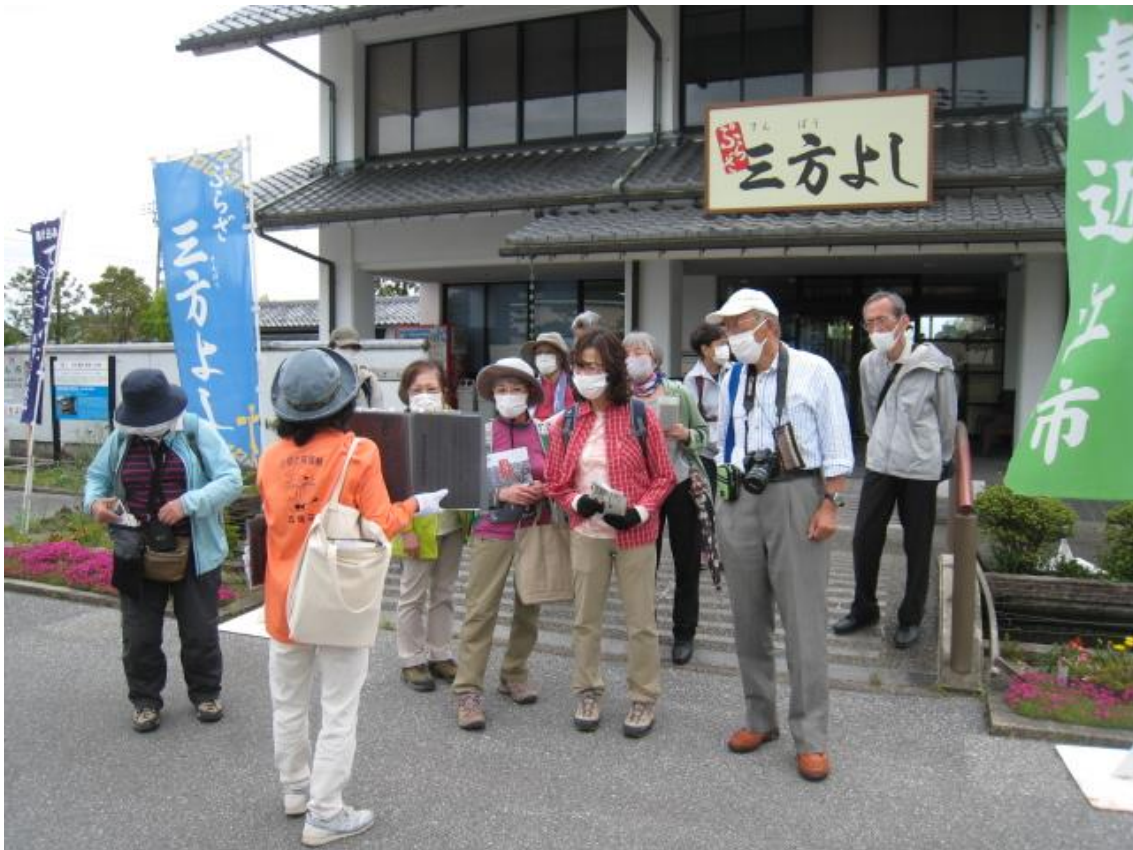
五個荘金堂地区「ぶらざ三方よし」観光案内所前