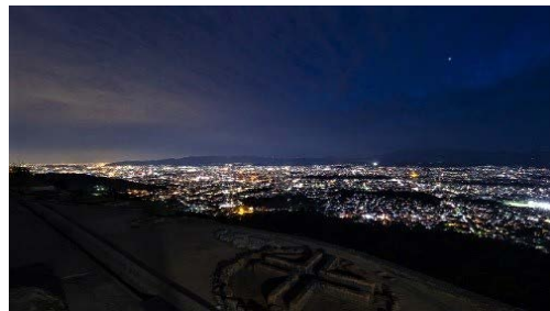
大文字山火床からの夜景