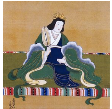
土佐光芳画『推古天皇像』叡福寺蔵

概況 概況：龍田古道は飛鳥時代以降、河内（大阪）と大和（奈良）を結ぶ山越えの道として利用されてきた歴史街道であり、推古天皇により置かれた我が国最初の官道とも言われています。大和川の亀の瀬地すべり歴史資料室は必見です。 天王寺発 8:42 大和路線～9:07 着・高井田駅