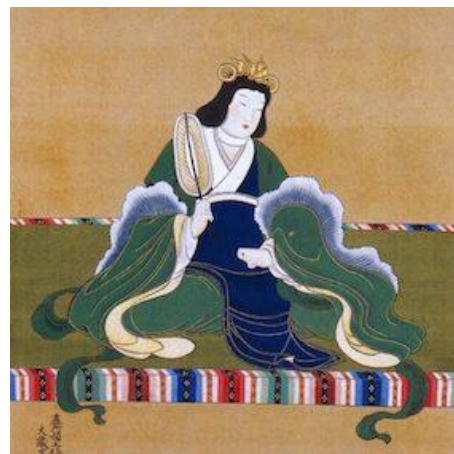
土佐光芳画『推古天皇像』叡福寺蔵

概況：龍田古道は飛鳥時代以降、河内（大阪）と大和（奈良）を結ぶ山越えの道として利用されてきた歴史街道であり、推古天皇により置かれた我が国最初の官道とも言われています。大和川の亀の瀬地すべり歴史資料室は必見です。 天王寺発 8:42 大和路線～9:07 着・高井田駅