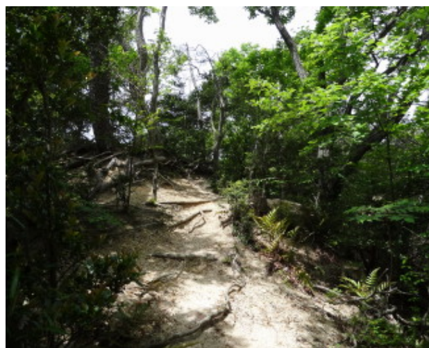
アカシア尾根

コース 阪急芦屋川駅～高座の滝～高座谷～アカシア尾根～横池～雌池～パノラマルート～五叉路～ダルマ岩～高座谷～阪急芦屋川駅（解散）