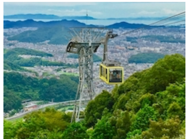
書写山ロープウェイ

コース 姫路駅北口＝バスで六角～六角坂～摩尼殿～山上見学～書写山ロープウェイ山上駅～東坂～書写山ロープウェイバス停＝姫路駅