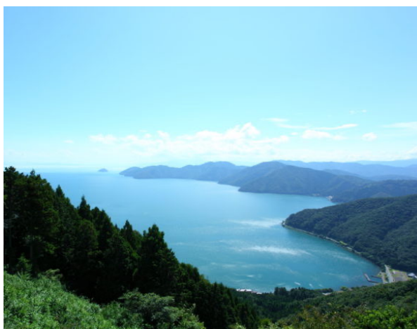
武奈ヶ岳から望む琵琶湖

コース 堅田駅（8:40）～（バス 8:50 発）～坊村（9:27）～御殿山～武奈ヶ岳～八雲ヶ原～北比良峠～大山口～イン谷口～比良駅＝大阪駅