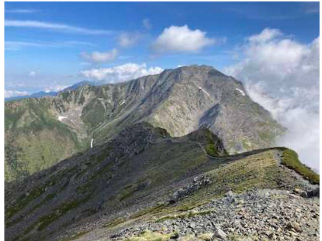
南アルプス間ノ岳

概況 小屋4泊5日+（夜行バス泊）で百名山を3峰。アップダウンを満喫できる南アルプス大縦走コースです。しっとりとした樹林帯歩きと、明るい高山帯縦走の両方を存分に味わえます。総距離約30km。