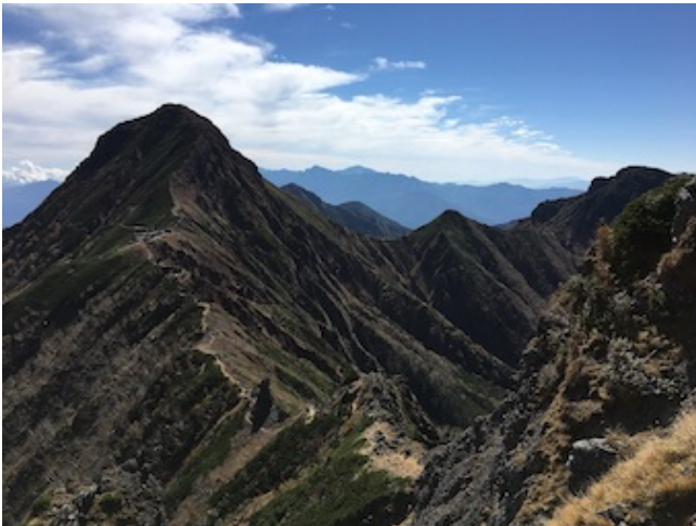
八ヶ岳 過去の山行より

山行名：南八ヶ岳縦走 実施日：9月23日（木）～25日（土） 予備日9月26日（日）