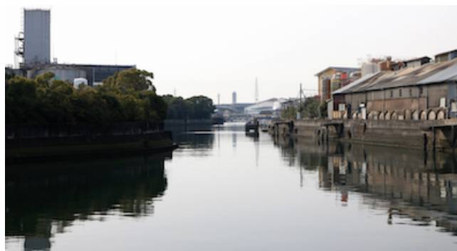
飾磨津物揚場跡

コース 飾磨駅 9:30～向島橋～御船役所跡～東堀水門～飾磨津物揚場跡～魚屋堀跡勤王志士上陸跡碑～浦手番所跡～港ドーム（旧国鉄飾磨港駅）～焼あなごの“はなおか”～湛保と藤田翁顕彰碑～海神社～姫路みなとミュージアム～御台場跡碑～公園（昼食）～浜の宮天満宮～旧姫路藩御蔵跡の碑～有本芳水歌碑～恵美酒宮天満宮～飾磨区宮・大浜地区の町並み～銀の馬車道（栄町商店街）～御旅所（恵美酒宮天満宮）～「飾磨街道」石道標～亀山御坊本徳寺～15:00 山陽電鉄亀山駅解散（歩く距離：約 8 km）