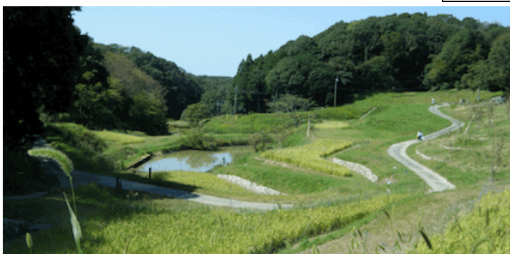
あいな里山公園 下見山行より