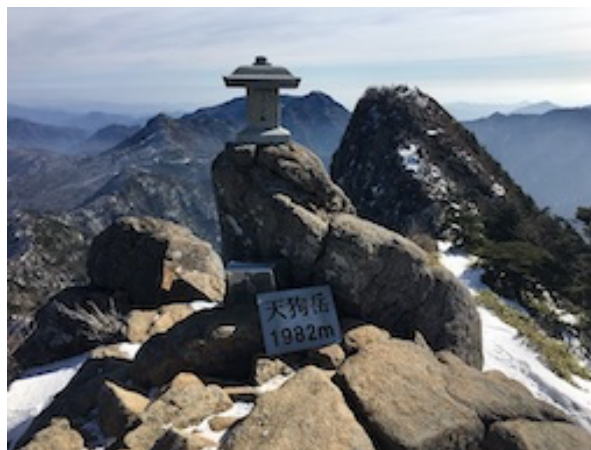
天狗岳山頂より東稜方向を望む