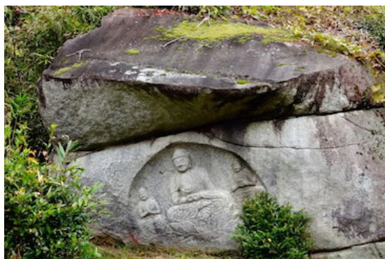
わらい仏