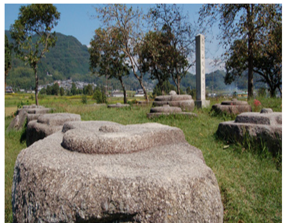
史跡恭仁宮跡 （山城国分寺跡）

コース 加茂駅 9:10 発～バス（¥190）～9:13 バス停・岡崎～大井手用水路～急で長い登坂～海住山寺（境内¥100、本堂¥400）～山中のけものみち～加茂神社～デ・レーケ堰堤～大井手用水千木杭～恭仁宮大極殿跡～恭仁小学校～国史跡恭仁宮跡（山城国分寺跡）・昼食～くのにのみや学習館～恭仁大橋北詰・万葉歌碑～恭仁大橋（木津川）～恭仁大橋南詰・万葉歌碑～江戸時代の旧家～船屋通り～小間安老舗（和菓子）～15:00JR加茂駅解散（歩く距離：約6km）