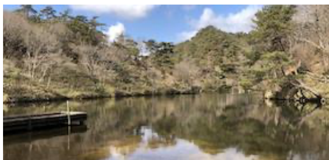
穂高湖とシェール槍（六甲山系）

杉谷は別名カスケードバレイとも言い、小さな滝が続く沢沿いのコースです。明治の初めに徳川道として整備されたが幕府が消失したと同時に幻の道になり、今では名前だけが残っています。穂高湖は六甲山系で二番目に大きな人工湖でアルプスのきれいな景色を思わせる穂高連峰から命名されています。湖の畔で昼食の後は杉谷峠に戻り、別名ゴートリッジとも言われる山羊戸渡へ進む。名前は可愛いけどアップダウンの変化にとんで岩場ありで、ちょっとスリルのある痩せ尾根を下ります。六甲川と西谷が合する地点に下ると、その先は六甲ドライブウェイに沿って、六甲ケーブル下で解散。歩行：距離は約7キロ、約5時間。