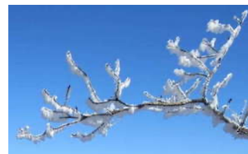
三峰山の霧氷

*バス・列車の時刻と集合時間は2021年の実績。2022年分は12月中旬に確定見込、 2月山歩案内にて確定版を案内します。