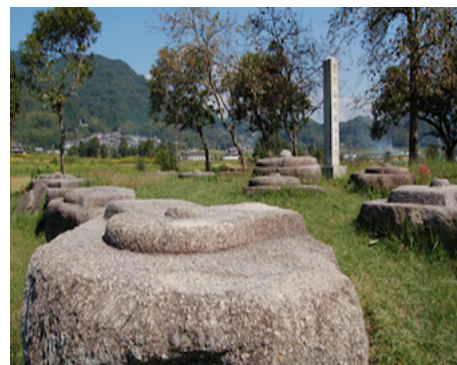
史跡恭仁宮跡（山城国分寺跡）

コース 加茂駅 9:10 発～バス（¥190）～9:13 バス停・岡崎～大井手用水路～急で長い登坂～海住山寺（境内¥100. 本堂¥400）～山中のけものみち～加茂神社～デ・レーケ堰堤～大井手用水千木杭～恭仁宮大極殿跡～恭仁小学校～国史跡恭仁宮跡（山城国分寺跡）・昼食～くにのみや学習館～恭仁大橋北詰・万葉歌碑～恭仁大橋（木津川）～恭仁大橋南詰・万葉歌碑～江戸時代の旧家～船屋通り～小間安老舗（和菓子）～15:00JR 加茂駅解散（歩く距離：約 6km）