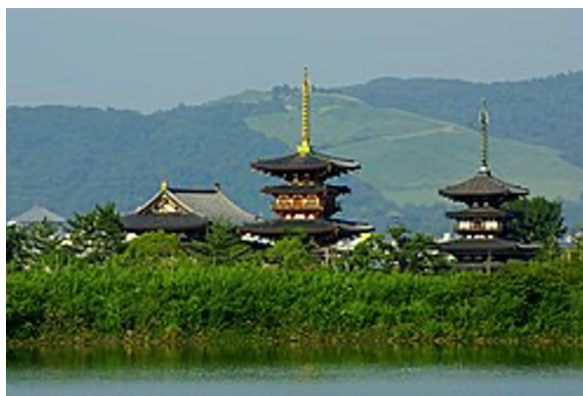
薬師寺 (大池越しに見える薬師寺)

概況 天平の風を感じる西ノ京を歩きます。喜光寺は聖武天皇が東大寺大仏殿建立の為、参考にされたとわれ、二百鉢余りの蓮の花が綺麗な寺です (副住職の説明有)。世界遺産唐招提寺・薬師寺を見学します。