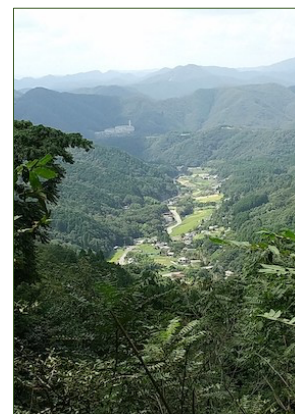
上杉尾根から望む黒川の里

概況 初谷溪谷は、何度も渡渉を繰り返す溪流沿いのコースで、「大阪みどりの100選」にも選ばれています。下りの上杉尾根からは、日本一と言われる「黒川の里山」が望めます。紅葉ハイキングとしましたが、紅葉には少し早いかも。歩行時間：約4時間20分（休憩除く）。地図：山と高原地図48「北摂 京都西山」