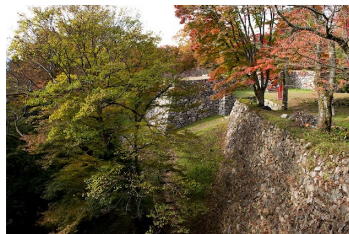
高取城跡

コース 壺阪山駅発 9：45～バス（¥320）～壺阪寺下車～五百羅漢群～勘太郎墓～八幡神社～壺阪口門跡～高取城本丸跡（昼食）～国見櫓跡～宇陀門跡～二ノ門跡～猿石～太郎墓～一升坂～七曲り～島流社～観音院～宗泉寺～黒門跡～上子島沢砂防公園～星野家～植村邸（元高取藩家老屋敷・長屋門）～旧城下町土佐集落～16：00 壺阪山駅解散（歩く距離：約 8 km）（壺阪山駅発 16：22 急行大阪阿部野橋行～17：12 着・大阪阿部野橋駅）